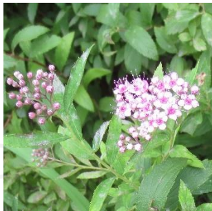
シモツケ(下野)バラ科 KR