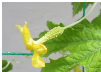
↑ 港南緑水公園 白ゴーヤの雌花です