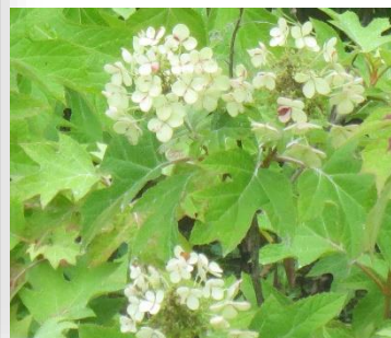
カシワバアジサイ(柏葉紫陽花) まるでアンティークのようなイメージ