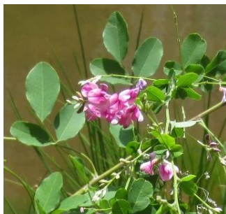
ヤマハギ(山萩) マメ科 KR