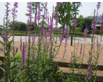
ミソハギ(禊萩) ミソハギ科 SC

芝浦中央公園管理事務所 TEL 03-6433-2562 〒108-0075 港区港南1-2-28