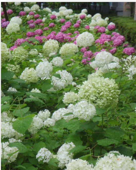
愛育病院との境に咲くアジサイ 白と赤味がかった紫のコントラストが印象的です