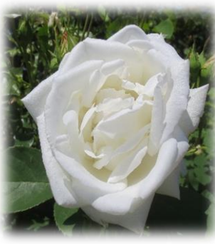
フラウ・カール・ドルシュキ ハイブリット・パーペチュアル