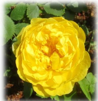
ロサ・フェティダ・ペルシアーナ 原種系