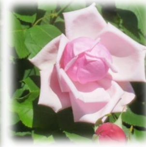
モダンローズ第1号 ラ・フランス ハイブリット・ティー