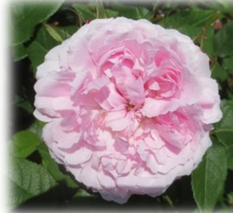
ジャック・カルティエ オールドローズ