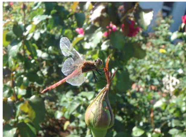
「バラとアカアカネ」 芝浦中央公園