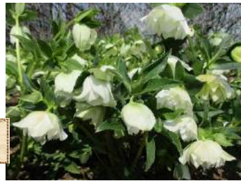
クリスマスローズ