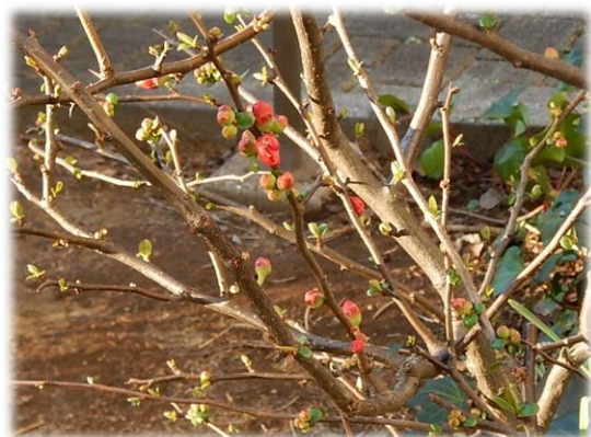
お台場レインボー公園 ボケ 花言葉「先駆者」