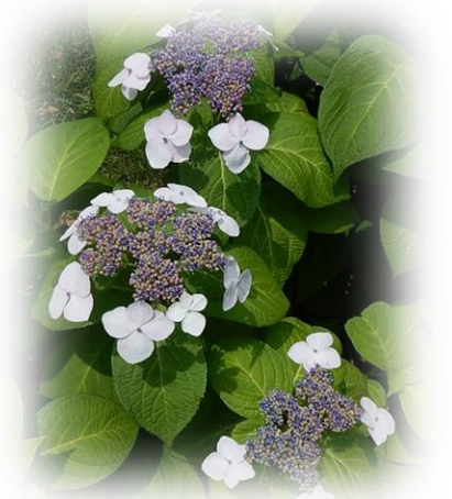
お台場レインボー公園