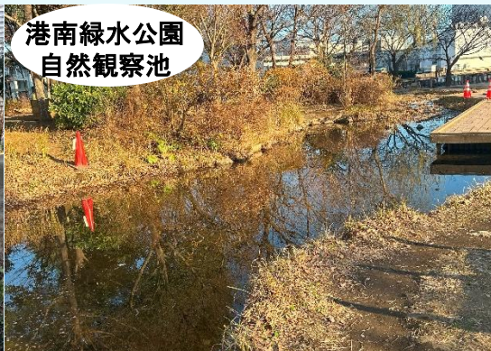
港南緑水公園 自然観察池

四季折々の公園の様子やイベントの情報など発信しています！ フォローよろしくお願いします！