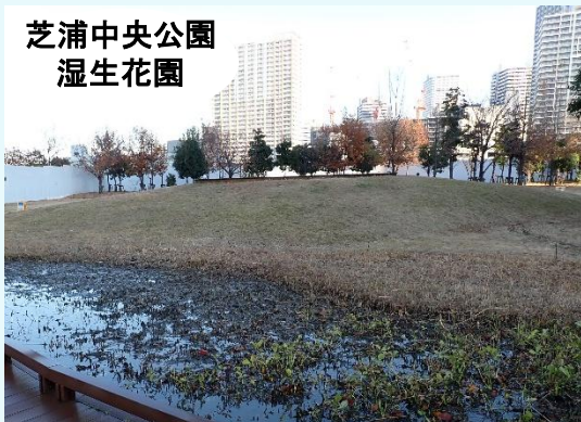
芝浦中央公園 湿生花園